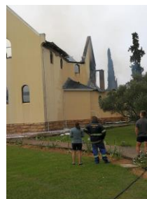
NG kerk brand af

Getalle, geld, interne spanning, hofsake, sekularisasie, politieke onstabieleit